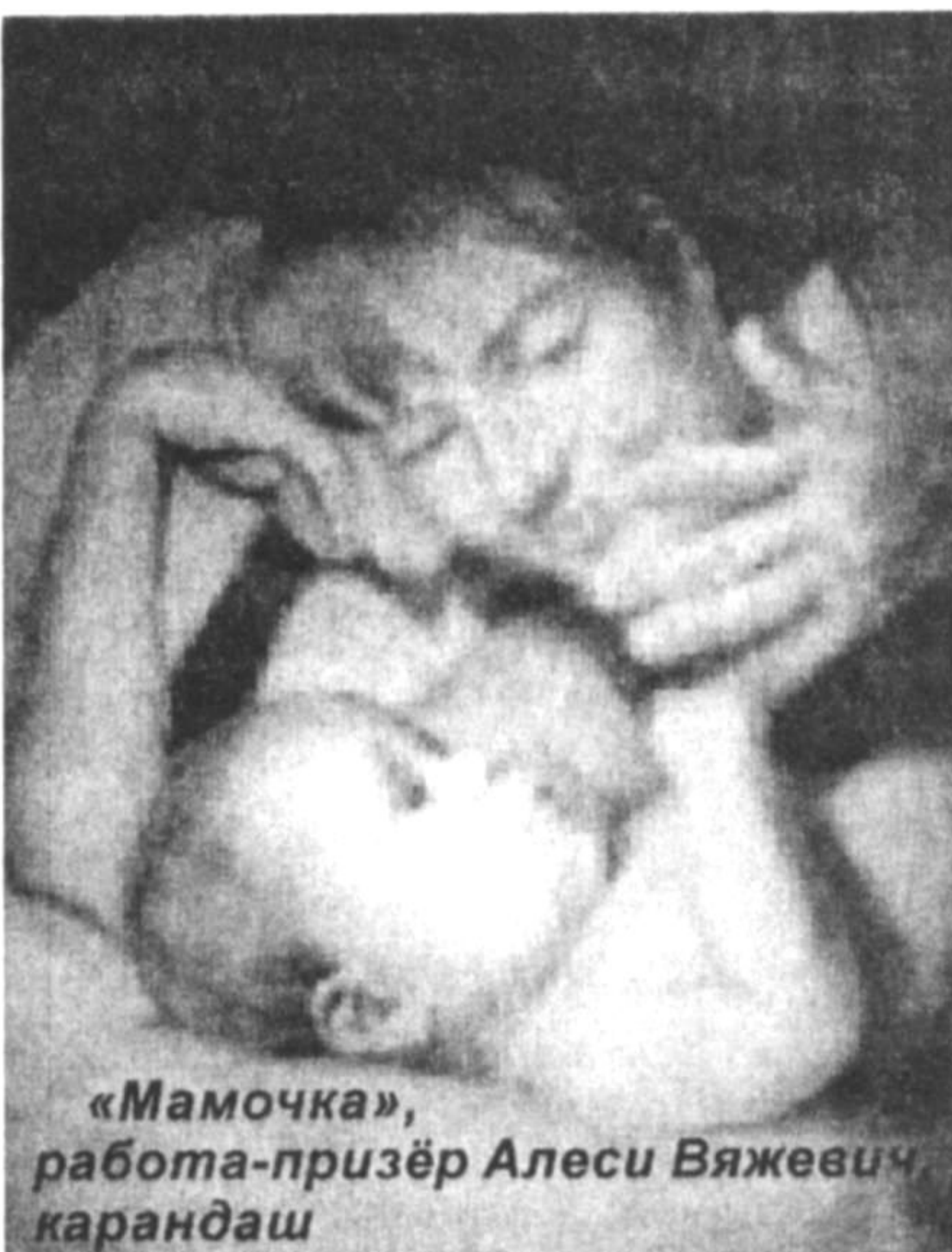
«Мамочка», работа-призёр Алеси Вяжевич карандаш

Люди как звезды. Есть гиганты и карлики. Ясные, лучи которых способны озарить самую мрачную ночь, и тусклые, невидимые и в телескоп. Есть холодные, безжизненные, а бывают и пламенные, согревающие даже на расстоянии тысячи лет космического пути. Есть звезды земные: эстрада просто пестрит разномастными астероидами разного калибра!